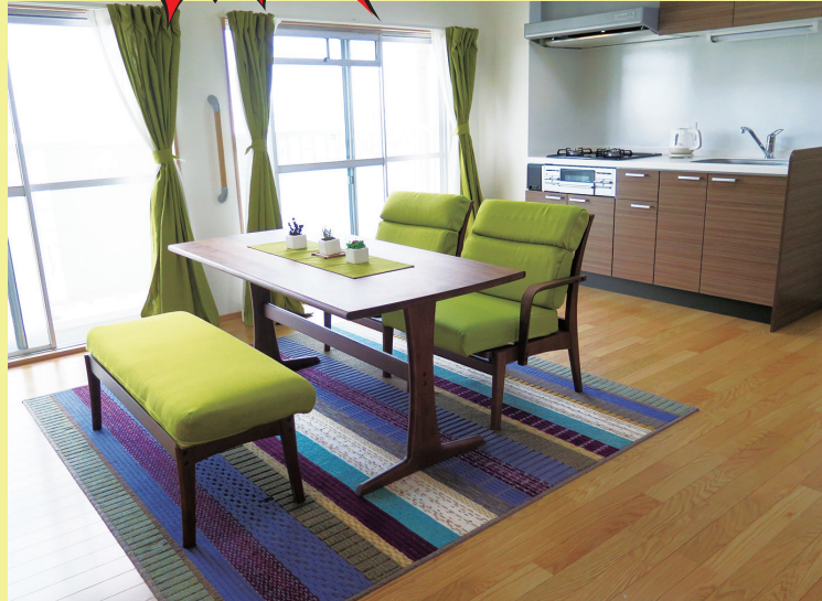
①明るく広びろとして開放感のあるリビングダイニングキッチン。ワンルームとしても使える広さを確保。