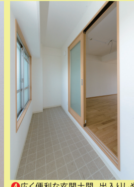
④広く便利な玄関土間。出入りしやすく、モノを置いたり、飾ったりと、使う楽しみも広がります。

愛知県住宅供給公社からの住棟の賃貸期間▶「ゆいま〜る大曽根」は平成52年3月31日を最終とする定期建物賃貸契約 【施設概要】●事業主体:株式会社コミュニティネット ●名称:ゆいま〜る大曽根 ●所在地:愛知県名古屋市中区山田二丁目11番62号 ●交通:地下鉄平安通駅から徒歩10分(636m)、JR・名鉄・地下鉄大曽根駅から徒歩15分(1,000m) ●用途用地:第1種中高層住宅専用地域 ●敷地面積:16,267.13㎡(愛知県住宅供給公社賃貸住宅を含む) ●建築面積:1・2号棟1,920.36㎡(愛知県住宅供給公社賃貸住宅を含む) ●延床面積:1・2号棟16,018.37㎡(愛知県住宅供給公社賃貸住宅を含む) ●構造規模:鉄骨鉄筋コンクリート造11階建 ●住居数:40戸 ●間取り:1LDK ●専有面積:49.95㎡(PS含む) ●住居の権利形態:定期賃貸借方式 ●既存建物完成年:1973年 ●竣工:2017年9月20日(予定) ●開設:2017年9月25日(予定) ●費用・サービス等:家賃65,100円~74,100円(要入居時敷金/家賃2ヵ月分)、生活サポート費1人37,800円/2人45,360円(消費税込)、共益費5,000円(1戸/非課税) ●設計:株式会社朋和設計 ●施工計:株式会社土樹和 ●建物計:定期建物賃貸借(期間:20年)