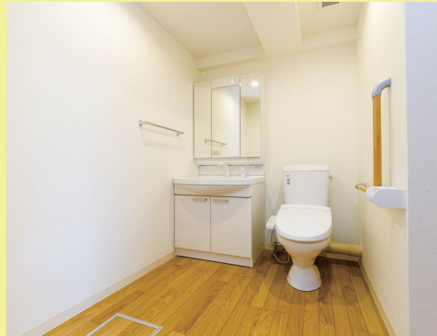
③車いすも入れるほどゆったりとしたバリアフリーの洗面・トイレ。