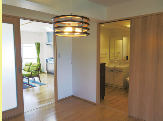
②扉は引き戸で、段差のない室内、暮らしやすいバリアフリーの1LDKです。