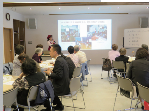
6つのグループに分かれた参加型のセミナー