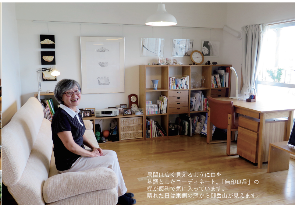
居間は広く見えるように白を基調としたコーディネート。「無印良品」の棚が便利で気に入っています。晴れた日は東側の窓から御岳山が見えます。