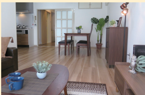
2LDK「Jタイプ」(モデルルーム) LDKの脇には和室あり