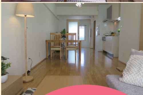
1LDK「Sタイプ」(モデルルーム) 風通しのよい広々リビング