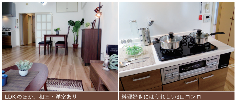
LDKのほか、和室・洋室あり