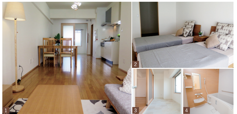
[1] 広々とした17帖のLDK [2] ベッド2台が置ける寝室 [3] 広い玄関土間は使い方次第 [4] 浴室にも手すりがあり安心