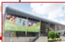
スタジオ、ジム、プールを備えたスポーツクラブ。