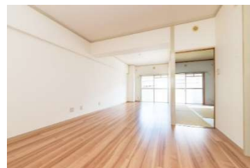
南向きで明るいリビングと和室

間取りは既存の和室を残したJタイプ。浴室はSタイプと同様のユニットバスにしたKタイプが登場しました。