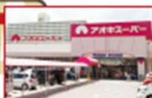
1階に美容院、クリーニング店、隣にドラッグストアもあるので便利。