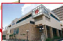
手頃な料金で楽しめる「碧心の天然温泉」。お食事だけの利用可。