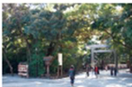
1万坪の境内がある「熱田神宮」。

徒歩3分以内に、スーパー、スポーツジム、温泉施設などがあり、便利に暮らせる環境です。日本三大神宮の一つ「熱田神宮」まで、バス1本で気軽に行けるのも魅力です。