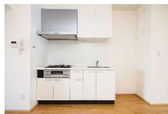
三口コンロ完備のキッチン