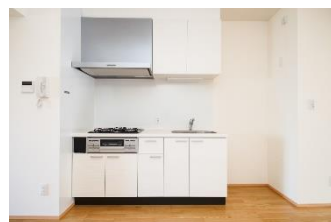
三口コンロ完備のキッチン