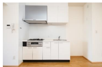
三口コンロ完備のキッチン