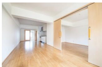
全戸南向きで明るいリビング