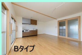
Bタイプ 段差のない広びろ使える1LDK 開口部も間口の広い引き戸に