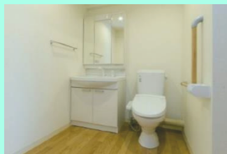
全タイプ、トイレ、洗面、浴室には 手すりを設置