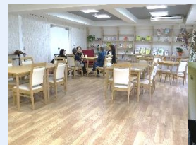
大集会室“わらわら広場”