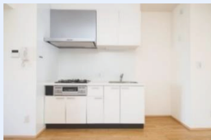
3口コンロ完備のキッチン