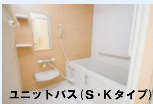
ユニットバス(S・Kタイプ)