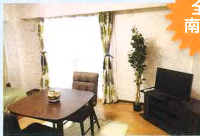
居室の窓はインナーサッシ、洋室は床暖房設置